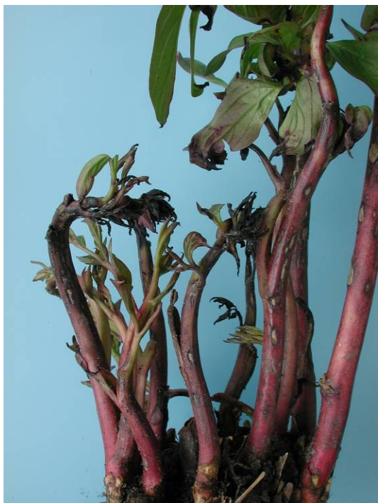
Foto 5. Door Phytophthora aangetaste plant