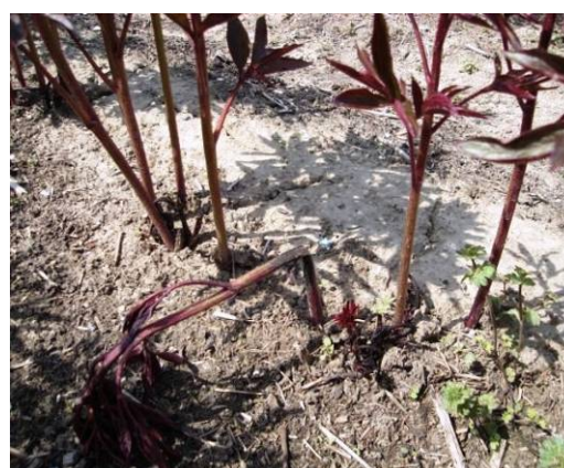
Foto 2. Door Phytophthora aangetaste scheut