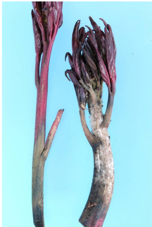
Foto 4. Phytophthora aantasting