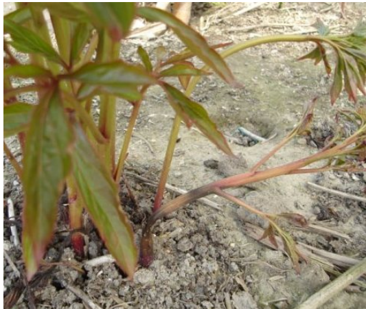
Foto 3. Door Phytophthora aangetaste scheut