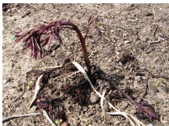
Foto 1. Omgevallen scheuten door Phytophthora

Onderstaand enkele foto's van Phytophthora aantasting van pioenroos.