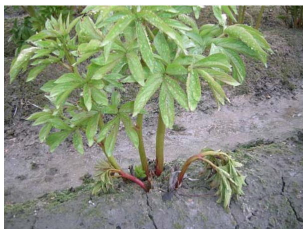
Afb. 1. Omvallers Pioen na uitloop