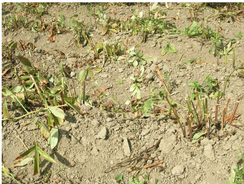
Afb. 3. Behandeling gewas afgemaaid "op 10 cm" en "laten liggen"

Het verwijderen van bladresten is met behulp van de bladhark uitgevoerd en resten zijn afgevoerd.