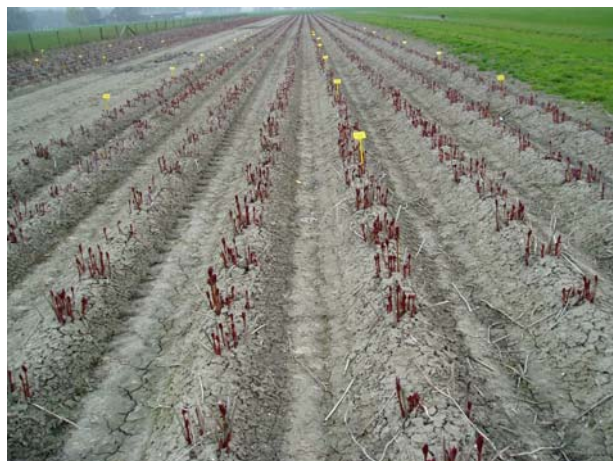
Afb.2. Overzicht proefveld in Heerhugowaard, vóór en tijdens uitloop van scheuten (l. resp. r.).